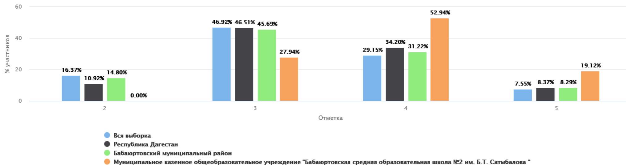
Распределение групп баллов(%)