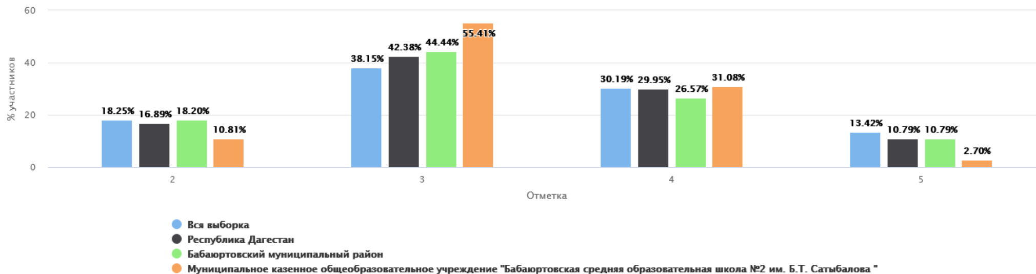
Распределение групп баллов(%)