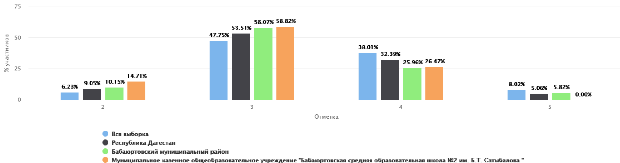
Распределение групп баллов(%)