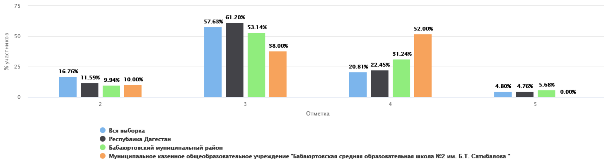
Распределение групп баллов(%)